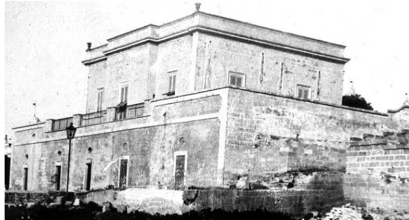
Villa Ardi di Santa Maria di Leuca in una foto d'epoca

Convegno sulla figura del progettista che ideò le ville eclettiche edificate nella «Perla dei due mari»