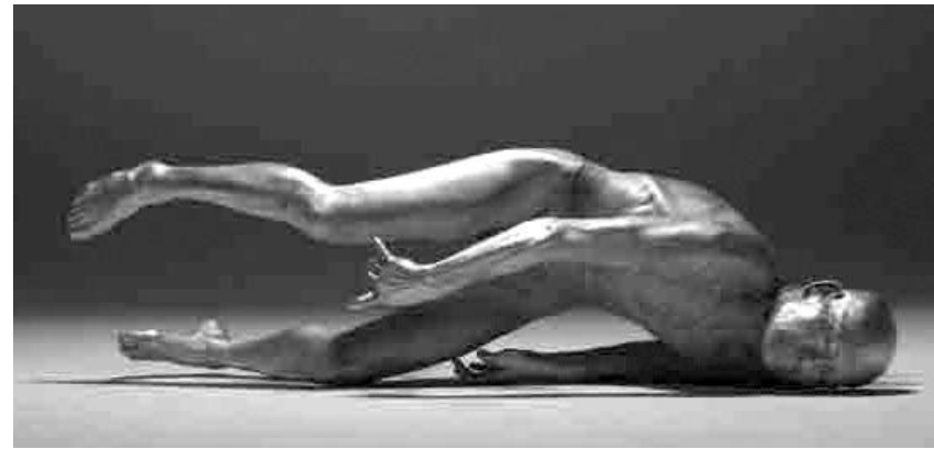
Il maestro giapponese Ko Murobushi sarà fra i protagonisti di «Atnarat. La danza rivolta»

Ultimi passi di «Torcito Parco danza». Cala il sipario sulla manifestazione organizzata dall'associazione culturale Metalogo.it con la direzione artistica di Piero Andrea Pati e la consulenza di Elektra Compagnia delle arti del corpo mediterraneo, con il patrocinio di Provincia di Lecce e dell'Unione dei Comuni della Grecia Salentina.