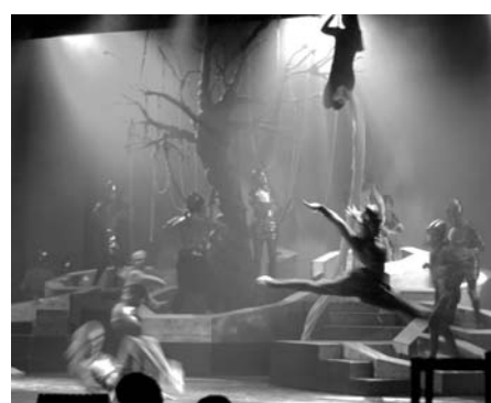
Un momento di «Federico II. La danza del falcone»